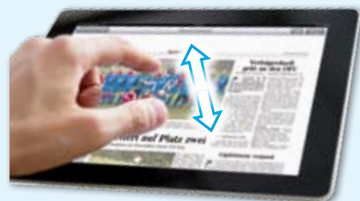
... oder ziehen mit zwei Fingern den gewünschten Bereich auf.