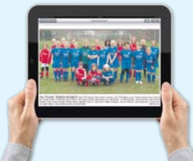
Lesekomfort durch individuelle Bildschirmanspannung. Ob quer ...