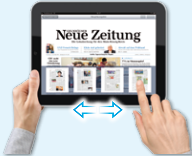
Oder Sie nutzen die Miniaturvorschau am unteren Rand des Bildschirms.