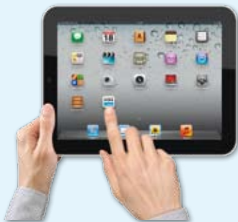
Schneller als der Gang zum Briefkasten: die GNZ-ePaper-App.

Also: Einfach die GNZ-ePaper-App aus dem App-Store® auf Ihr iPad® laden und los geht's!