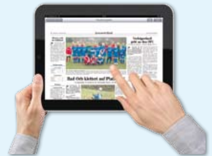
Zum Vergrößern tippen Sie doppelt auf einen Artikel oder ein Foto ...