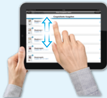
Im ersten Fenster wählen Sie die GNZ-Ausgabe, die Sie lesen möchten.