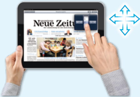
... um schnell und direkt zu einer anderen Seite zu gelangen.