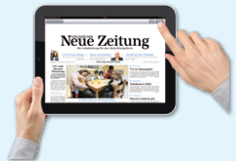
Schon erscheint die Titelseite. Zum Navigieren tippen Sie oben rechts in die Ecke ...