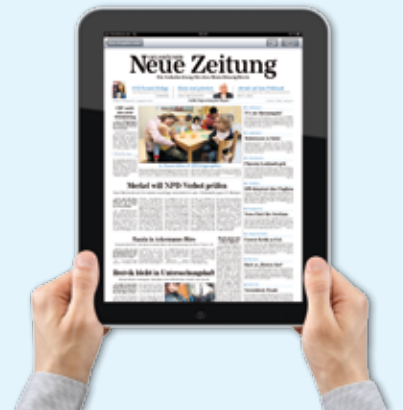
... oder im klassischen Hochformat – drehen Sie sich die GNZ, wie sie Ihnen am besten gefällt!